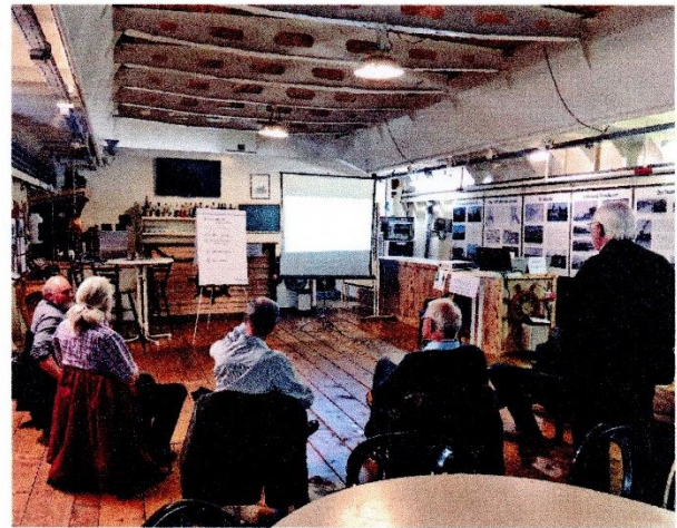
Zukunftsvisionäre im Gespräch