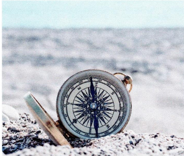
Kurs nehmen auf die Vision Altes Land 2050

„Wer keinen Kompass hat, wird irgendwo hingespült.“