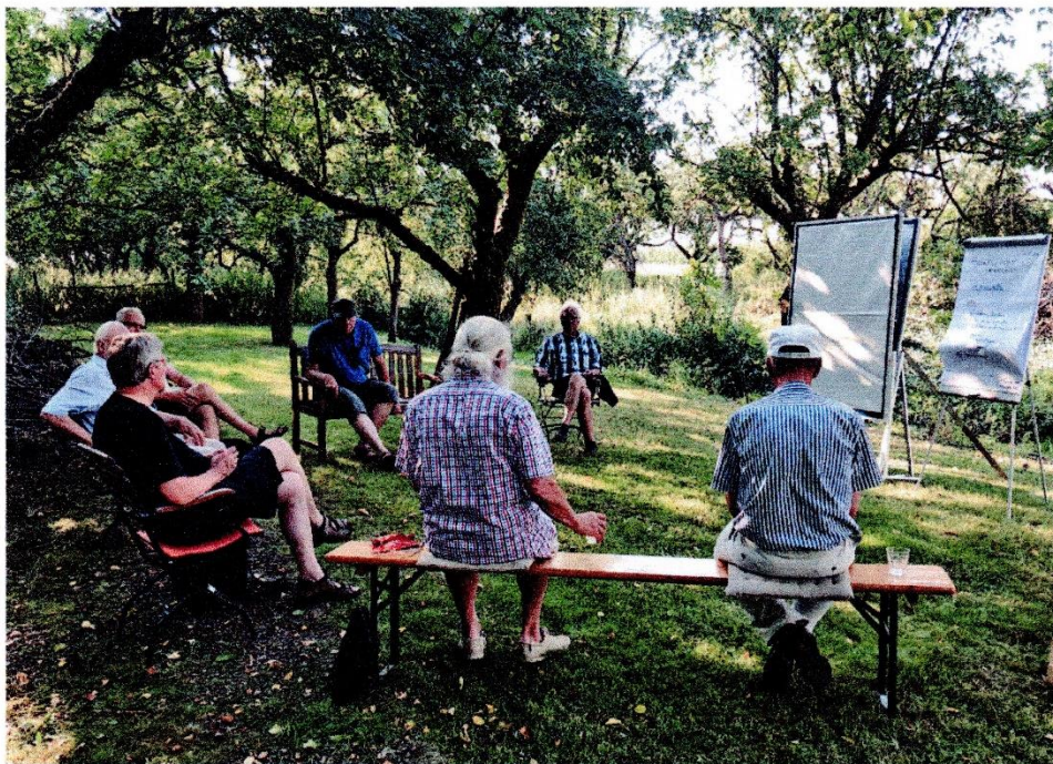
Recherchieren, debattieren, konzipieren - für die Zukunft des Alten Landes

Also machten sie sich an die Arbeit. Am Anfang war die Bestandsaufnahme: „Wo stehen wir? Was sind die unveränderlichen Gegebenheiten, die lokalen Besonderheiten, die ausschließlich für un-